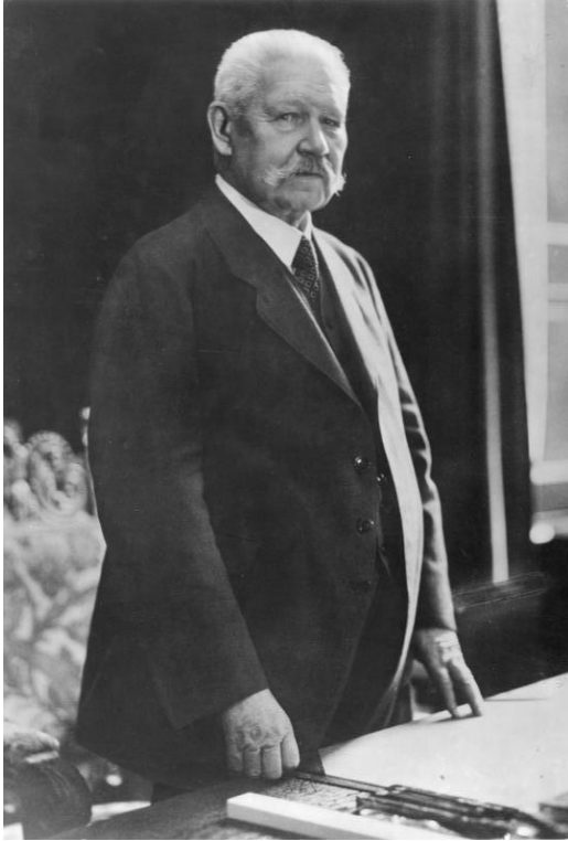
Abb. 2: Hindenburg 1932 12

Hindenburgs Leitgedanken „nationale Einheit“ oder „Volksgemeinschaft“ beruhten also nicht auf wirklicher Einheit aller Deutschen, sondern nur der nationalistisch Gesonnenen, wobei hier explizit die Sozialdemokraten ausgeschlossen blieben. Somit ist bei Hindenburg die „Volksgemeinschaft“ genauso verlogen wie bei Hitler, bei dem alle Nichtdeutschen, v. a. die Juden, ausgeschlossen waren. „Einheit“ war insofern bei Hindenburg als überparteiliche Gemeinschaft aller rechten Kräfte zu verstehen.