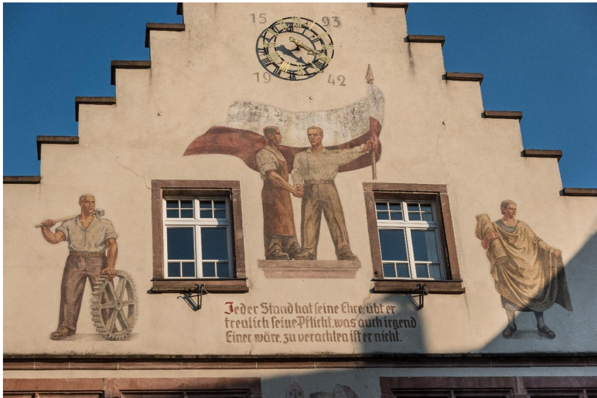
Abb. 5: Giebelspitze des Schiltacher Rathauses