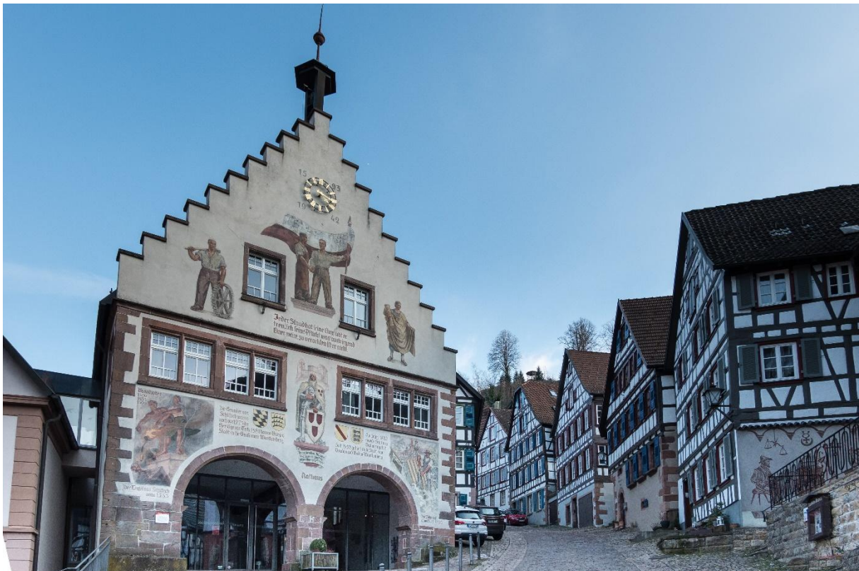
Abb. 1: Rathausfassade 2023

Dieser Artikel über die Erneuerung der Rathausfassade ist dreiteilig. Der erste Teil erzählt die Geschichte der Malerei und des ehemaligen Zitats an der Rathausfassade. In Teil 2 wird der Text des Hitlerzitats in die entsprechende Hitlerrede eingeordnet. Dieser dritte Teil ist meinen persönlichen Eindrücken der Rathausfassade inklusive meiner Interpretation der Symbolik gewidmet.