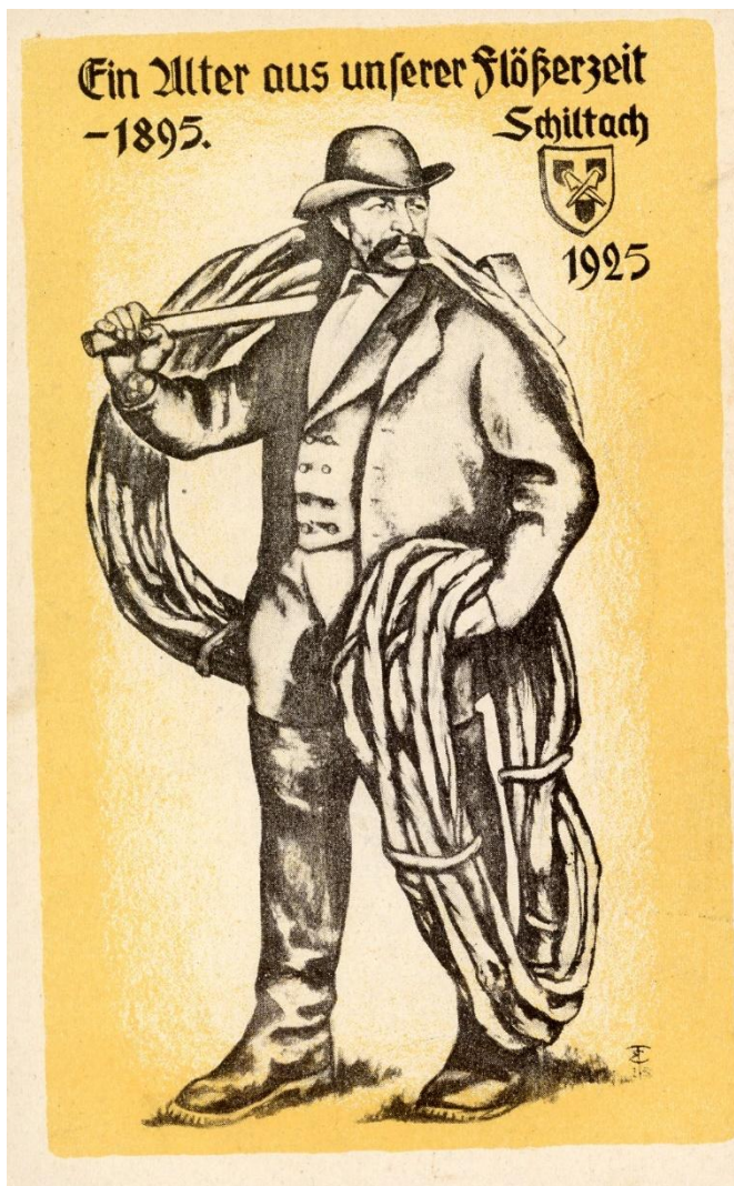
Abb. 7: Postkarte der Gewerbeausstellung 1925 23

Jedoch hatte sich Trautwein schon früh diesen Stil zugelegt. In einem direkten Vergleich besteht kein wesentlicher Unterschied in den Proportionen zu einem Flößerbild der Gewerbeausstellung von 1925, nur die Extremitäten sind noch breiter und detaillierter geraten.