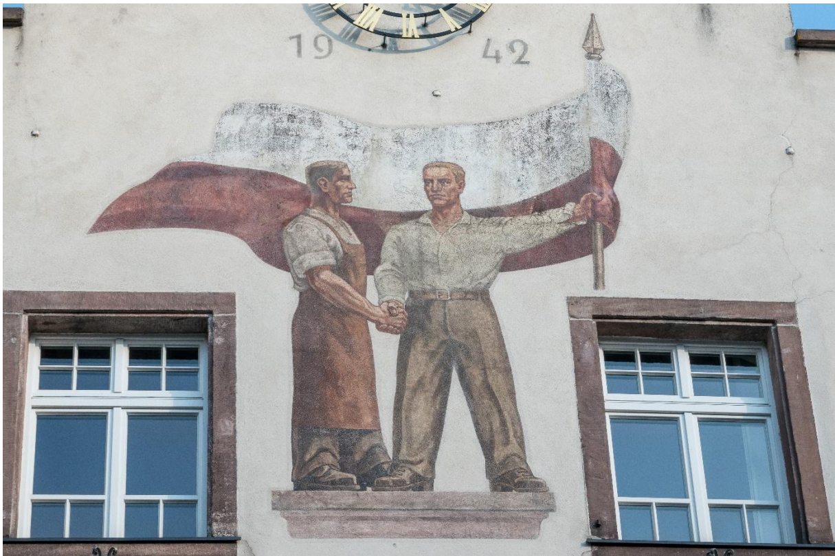
Abb. 6: Arbeiter der Faust und der Stirn reichen sich die Hand, © Helmut Horn

Faust und Stirn geben sich also hier die Hand, politische Einheit, Volksgemeinschaft , unter der Fahne des Hakenkreuzes, die nach dem Krieg durch die Schiltacher Flagge ersetzt wurde.