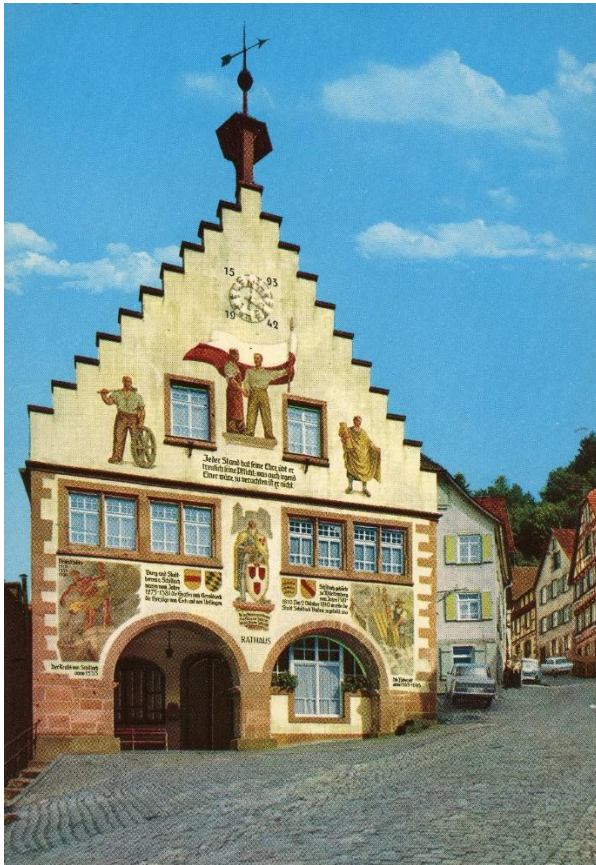
Abb. 11 (links): Die Rathausfassade von 1960 bis 1982 mit dem neuen Zitat 56