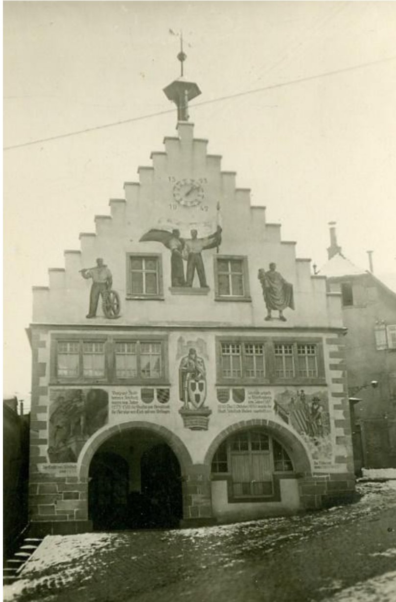
Abb. 10: Die Rathausfassade von 1945 bis 1960 ohne Zitat 55

1982 wurde die Fassade erneut renoviert, der Raum unter den Rundbögen grundlegend verändert und die Malereien konserviert. Das baden-württembergische Landeswappen ersetzte das ehemalige Wappen von Geroldseck, so dass die Reihenfolge von links nach rechts nicht mehr Geroldseck – Teck – Württemberg – Baden, sondern Teck – Württemberg – Baden – Baden-Württemberg lautete.