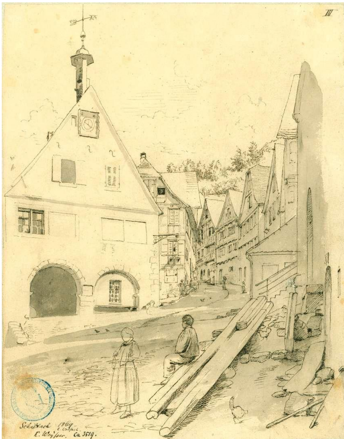
Abb. 4: Schiltach Rathaus mit Blick in die Schloßbergstraße, Gemälde von Karl Weysser von 1869 15