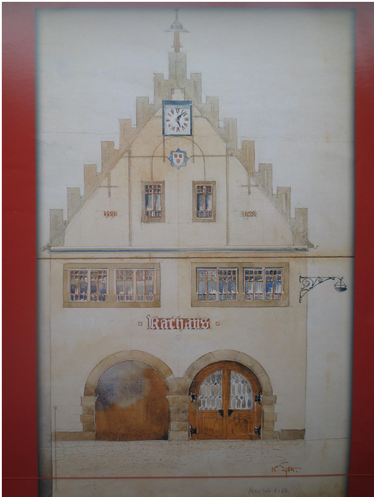
Abb. 1: Der Entwurf der Rathausfassade von Karl Eyth 1906 für den Umbau 1907 5