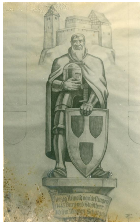
Abb. 7 und 8: Entwürfe von Eduard Trautwein für die Fassade 35

In der nächsten nichtöffentlichen Sitzung am 9.4. (und nicht 10.4.) wurde das Thema erneut beraten. Trautwein stellte seinen Entwurf für eine Rathausfassade im Gemeinderat vor.