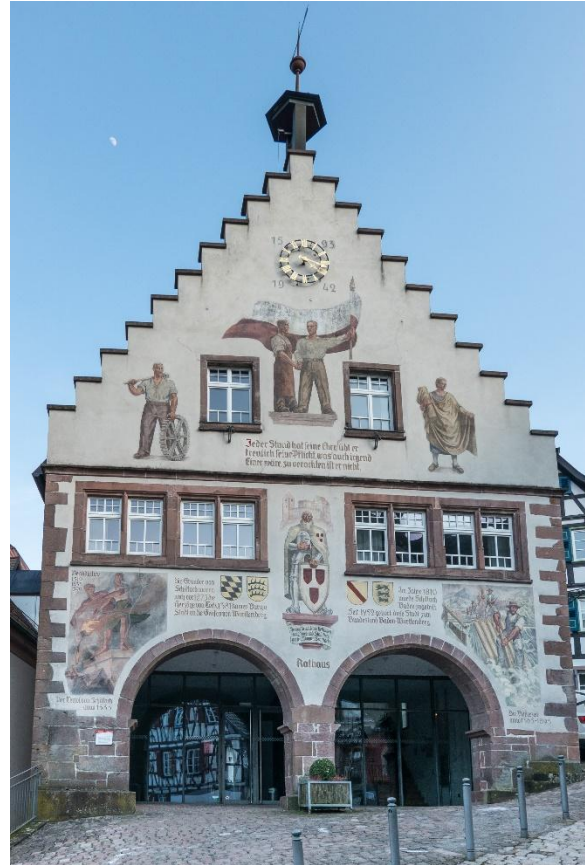
Abb. 12 (rechts): Die Rathausfassade 2023