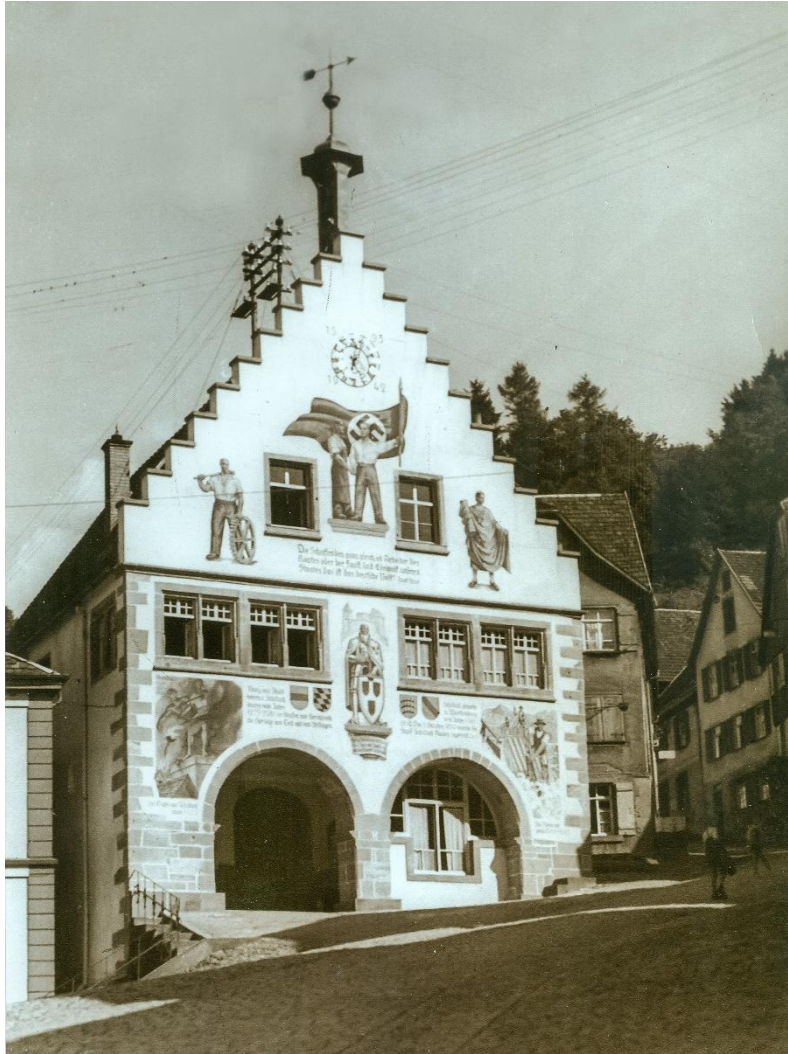
Abb. 9: Die Rathausfassade nach ihrer Erneuerung 1942 48