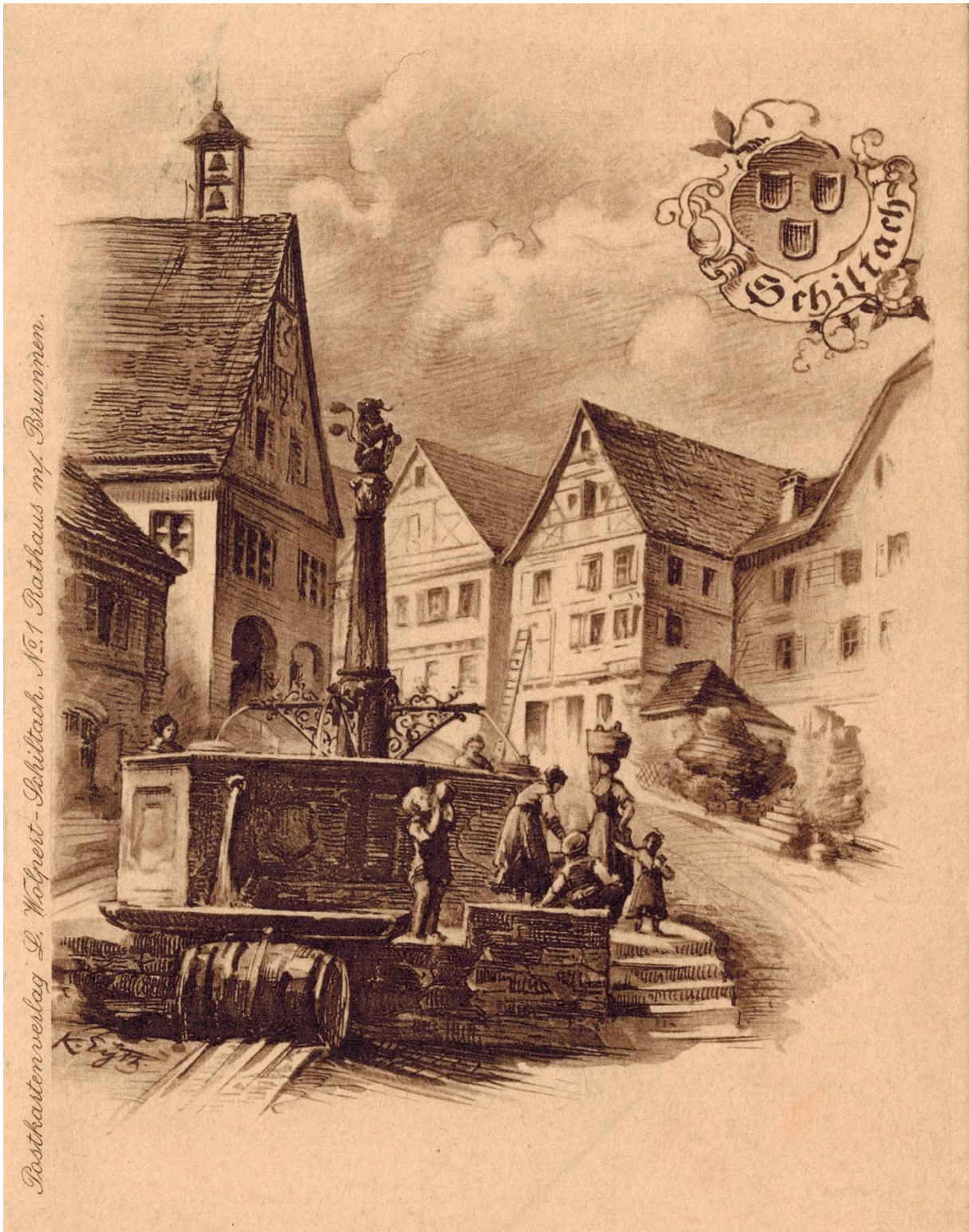
Abb. 2: Postkarte mit Gemälde Eyth, Brunnen am Marktplatz und Rathaus

Mit Altbürgermeister Wolpert und Fräulein Eyth wurde Rücksprache genommen wegen einem Bild des Rathauses vor 1907. Fräulein Eyth glaubt ein solches Bild zur Verfügung stellen zu können. 6