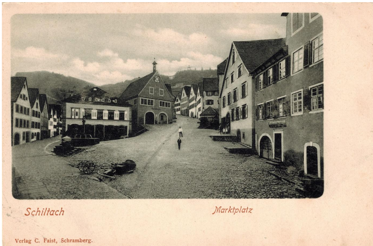
Abb. 3: Postkarte mit Rathaus vor dem Umbau von 1907

Offensichtlich benutzte man nicht ein Foto, was auch seinen Weg auf eine Postkarte fand.